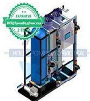
Установка ультрафильтрации ПВО-UF-10

Производительность 10 куб.м/час Масса 310 кг