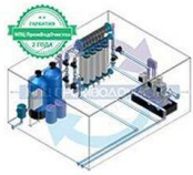
Установка ультрафильтрации ПВО-UF-40

Производительность Масса 40 куб.м/час 920 кг