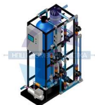
Установка ультрафильтрации ПВО-UF-5

Производительность 5 куб.м/час Масса 205 кг