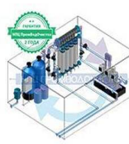
Установка ультрафильтрации ПВО-UF-20

Производительность 20 куб.м/час Масса 550 кг