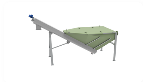
Горизонтальная песколовка ПВО-ПГ-100